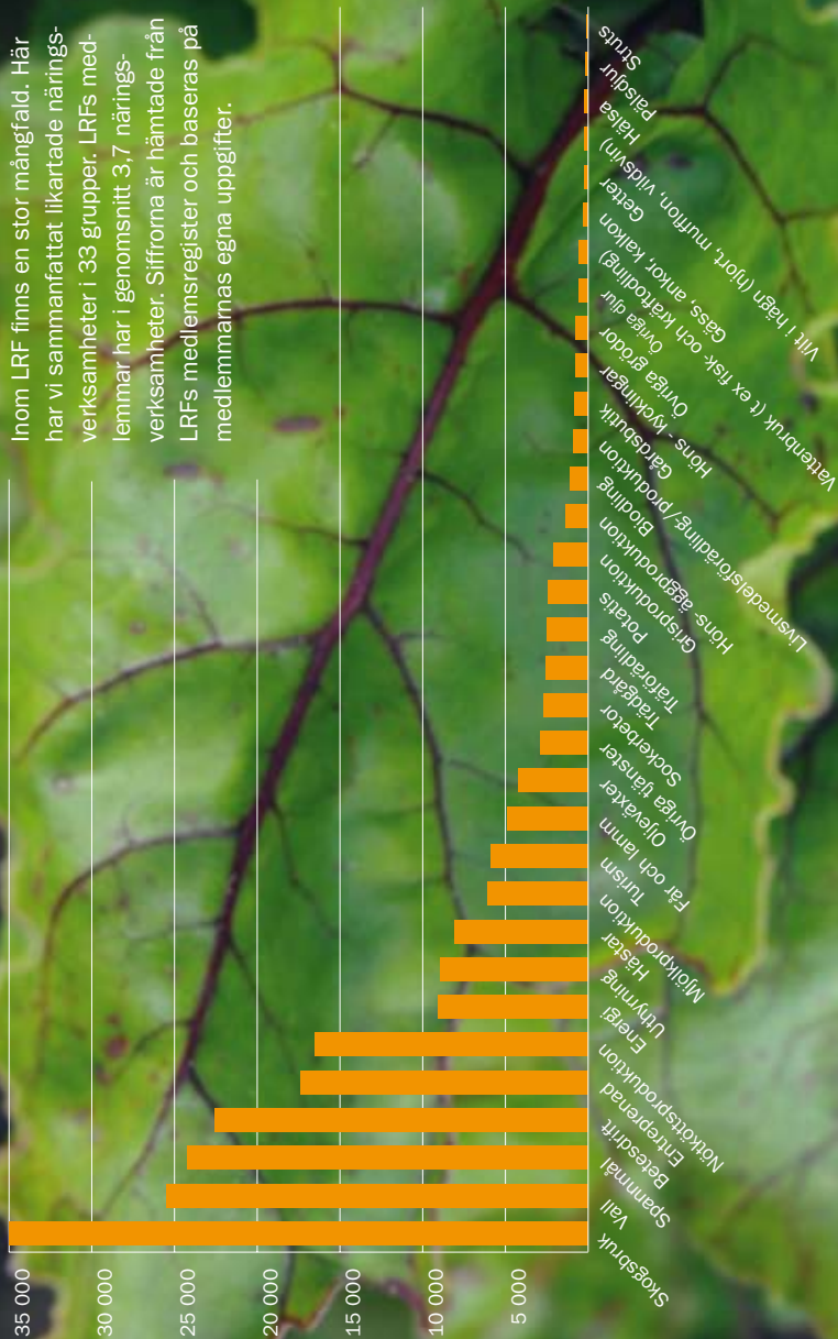
Antal inrapporterade näringsverksamheter under 2010

Inom LRF finns en stor mångfald. Här har vi sammanfattat likartade näringsverksamheter i 33 grupper. LRFs medlemmar har i genomsnitt 3,7 näringsverksamheter. Siffrorna är hämtade från LRFs medlemsregister och baseras på medlemmarnas egna uppgifter.